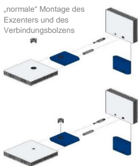
„normale“ Montage des Exzenters und des Verbindungsbolzens