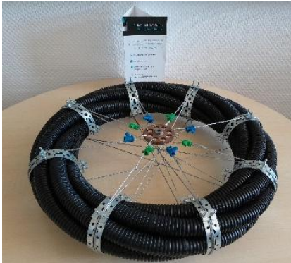
Muster eines gewickelten Rohrpakets

Die effiziente Nutzung von Wasserflächen zur Energieerzeugung gewinnt im Zuge der globalen Energiewende zunehmend an Bedeutung. Insbesondere schwimmende Photovoltaikanlagen (Floating PV) bieten eine vielversprechende Lösung, um den steigenden Flächenbedarf für erneuerbare Energien mit nachhaltigen Konzepten zu decken. Dabei nehmen Schwimmkörper als Trägersysteme eine zentrale Rolle ein: Sie gewährleisten nicht nur die statische Stabilität der Solarmodule, sondern beeinflussen auch maßgeblich die Wirtschaftlichkeit, Umweltverträglichkeit und Langlebigkeit der Gesamtanlage. Wissenschaftler der FH Aachen haben nun ein neues Konzept für Schwimmkörper entwickelt, das kostengünstig realisierbar ist und eine hohe Stabilität garantiert. Die einzelnen Schwimmkörper bestehen dabei aus einem als Endlosrohr leicht verdreht gewickeltem Ring aus drei oder mehr Wicklungen eines biegsamen Rohres. Dadurch wird nur eine Muffe benötigt, um den Ring wasserdicht zu verschließen. Gegebenenfalls ist zentral ein weiteres in sich geschlossenes Rohr angeordnet, um das die äußeren Rohre gewickelt werden. Auf diese Weise können beispielsweise Ringe mit einem Durchmesser von 2 bis 3 m und einer Auftriebslast von 1500 kg entstehen. Die Aufhängung im Zentrum des Rings gewährleistet eine maximal ruhige und verwindungsfreie Montageebene für die PV-Module.